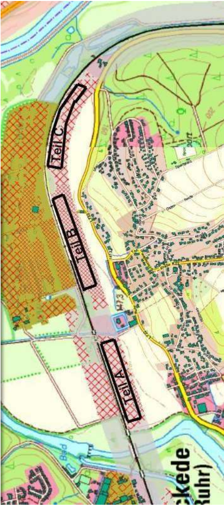
Bild 4) Potenzialflächen für PV-Anlagen noch LANUV (Landesamt für Natur, Umwelt und Verbraucherschutz NRW). Ein Teilgebiet „Teil C“ kommt hiernach auch als Freifeld PV-Anlage in Frage.