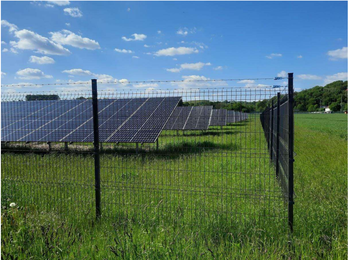
Bild 1) PV-Anlage Warmener Str. Zur Aufwertung der ökologischen Qualität sollte zwischen den Modulreihen genug Platz gelassen werden, damit Abschattungen möglichst gering werden.